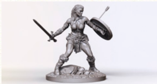
La figurine exclusive du salon